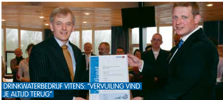
DRINKWATERBEDRIJF VITENS: "VERVUILING VIND JE ALTIJD TERUG"