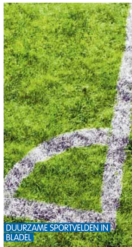
DUURZAME SPORTVELDEN IN BLADEL

Als één van de eerste gemeenten beheert Bladel de sportvelden zonder kunstmest en chemische bestrijdingsmiddelen. Door gebruik van nuttige bacteriën en schimmels in organische meststof ontstaat een stevige grasmat met een flinke laag wortels waarop onkruid weinig kans krijgt. Met een sportief resultaat: een uitstekend bespeelbare grasmat en schoon water!