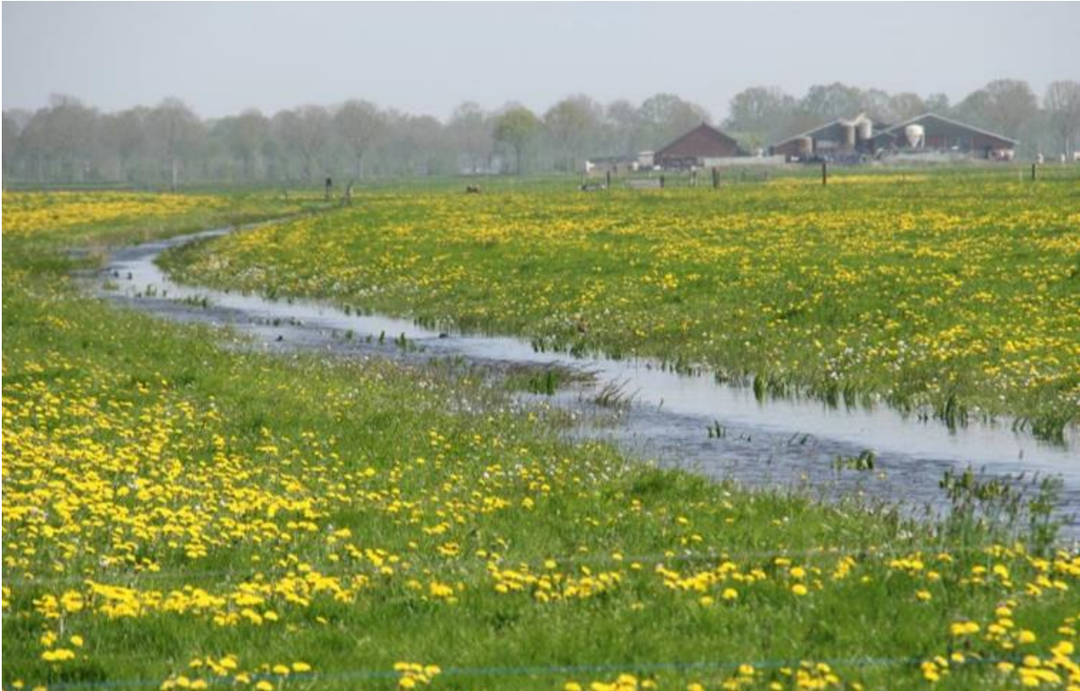
Foto 1: Greppel met hoog waterpeil voor weidevogels